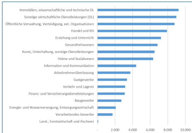
Struktur der sozialversicherungspflichtig Beschäftigten