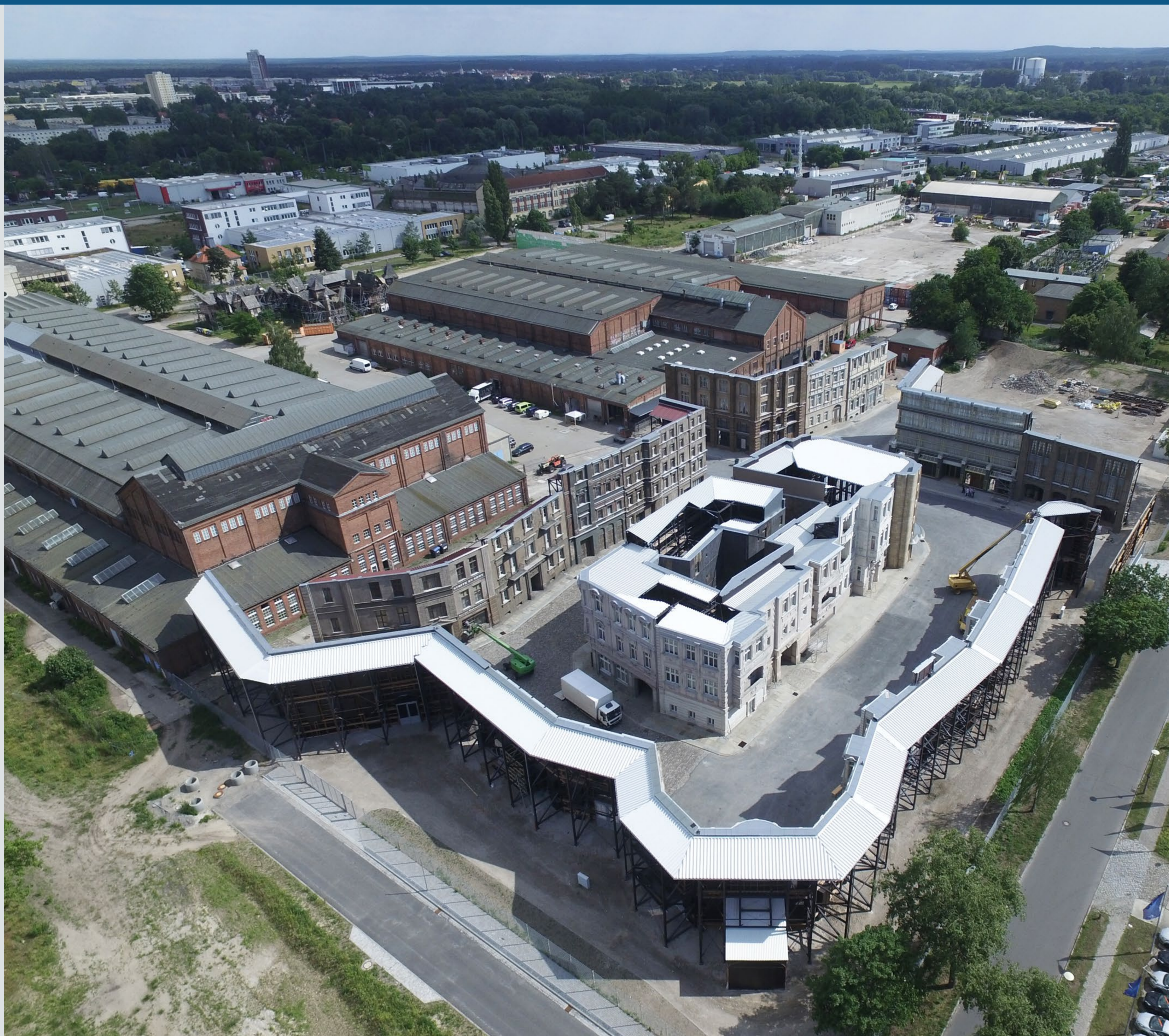
Metropolitan Backlot – die größte und modernste Außenkulisse Europas | Metropolitan Backlot – one of Europe's most extensive and modern backlots

Im November 1911 erwarb die Produktionsgesellschaft „Deutsche Bioscop“ eine leerstehende Kunstblumenfabrik und errichtete unter der Leitung von Guido Seeber ein Filmstudio. Im Februar 1912 fiel in dem Film-Atelier „Kleines Glashaus“ in Babelsberg die erste Klappe zu dem Stummfilm „Der Totentanz“ – mit diesem Geburtsdatum wurde Studio Babelsberg das älteste Filmstudio der Welt und die Wiege des deutschen Films.