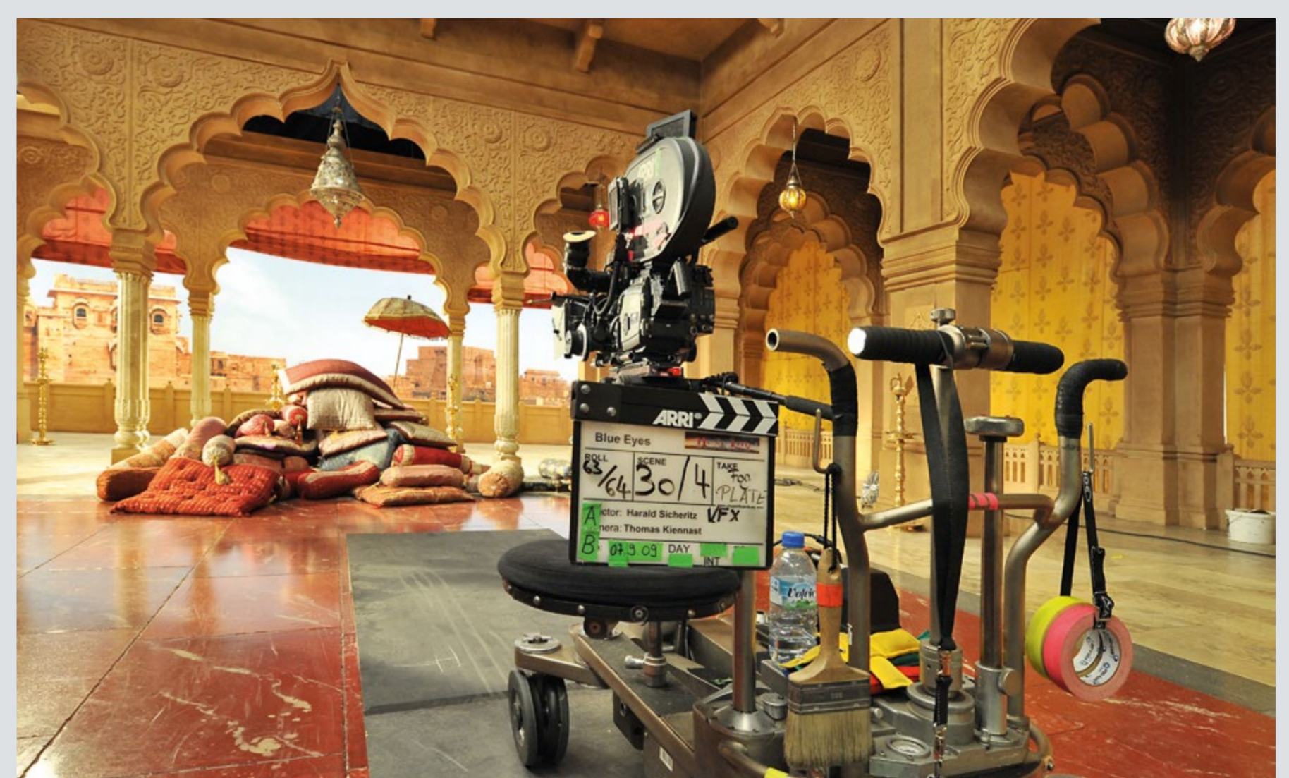
Kulisse von HEXE LILLI in der Marlene-Dietrich-Halle | Film set of HEXE LILLI in Marlene-Dietrich-Halle

After World War II, Deutsche Film AG (DEFA) took over and produced renowned films such as „The Story of Little Muck“ Today, Studio Babelsberg, which is the largest connected studio complex in Europe, produces German and international series, television and feature films. It is part of Media City Babelsberg, which includes UFA, the Film University Babelsberg KONRAD WOLF, RBB, the German Babelsberg Film Orchestra and about 200 other media and IT companies and institutions. In the Media City Babelsberg, there are the Marlene-Dietrich Halle (formerly the „Silent Hall“) built in 1926/27 and the so-called „Tonkreuz“ of 1929, which are both technical masterpieces of their time.