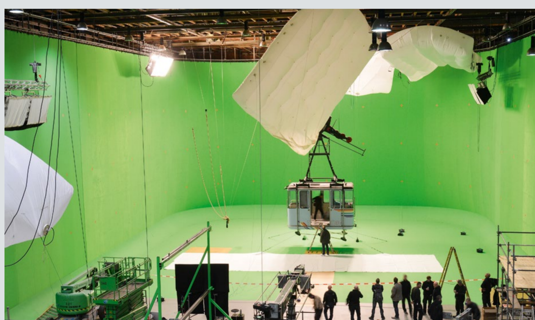
Dreharbeiten im Studio | Shooting in the studio

1921 übernahm die Ufa (Universum Film AG) die Filmproduktion. Es entstanden Filmklassiker wie „Metropolis“. Innovationen wie die „Entfesselte Kamera“ und der „Countdown“ kommen aus Babelsberg. Seither zieht der Ort Filmschaffende an, wie Alfred Hitchcock, Quentin Tarantino oder Wes Anderson.